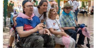
El estudio 'Soledad no deseada y DCA' muestra interesantes conclusiones

Según dicho estudio, el 35,1% tiene una discapacidad mayor del 65% y el 30,43% de más de 33%, mientras que el 26% está a la espera de su valoración.