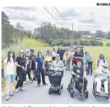
Participación de personas con daño cerebral en el Camino de Santiago.

El daño cerebral adquirido es la principal causa de discapacidad permanente, con más de 20.000 personas afectadas en la Comunidad Valenciana, donde la segunda enfermedad en términos de letalidad es el cáncer. La mitad de las personas afectadas por esta enfermedad son mujeres, que incluyen víctimas de tumores, accidentes, enfermedades infecciosas y traumatismos. Los datos del estudio sobre Soledad no Deseada y DCA, realizado por la asociación Daño Cerebral Valenciana, muestran que el 59,5% de las personas con DCA son mujeres, lo que indica una mayor vulnerabilidad de este colectivo. La mitad de las personas afectadas por esta enfermedad son mujeres, que incluyen víctimas de tumores, accidentes, enfermedades infecciosas y traumatismos. Los datos del estudio sobre Soledad no Deseada y DCA, realizado por la asociación Daño Cerebral Valenciana, muestran que el 59,5% de las personas con DCA son mujeres, lo que indica una mayor vulnerabilidad de este colectivo.